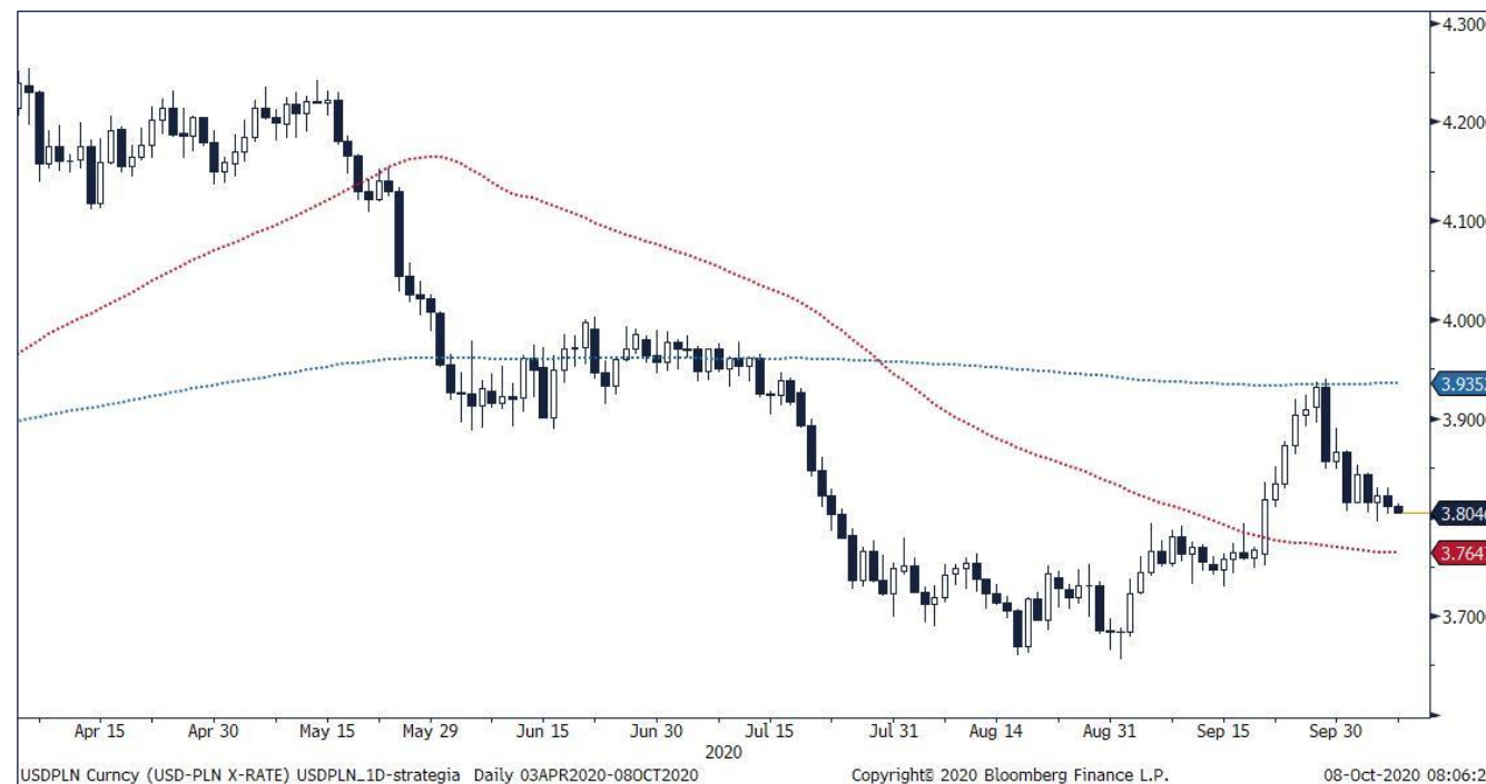
Wykres dzienny kursu USD/PLN.