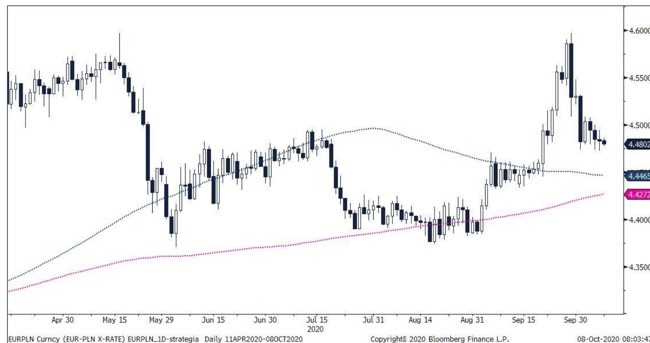
Wykres dzienny kursu EUR/PLN.