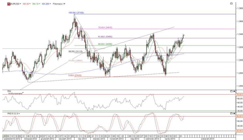
Rys. 1. Wykres dzienny kursu EUR/USD

Eurodolar kontynuuje wzrosty – kurs EUR/USD znajduje się powyżej 61,8 proc. zniesienia Fibonacciego ruchu spadkowego zapoczątkowanego w lutym tego roku i zbliża się do szczytów z czerwca (1,3420). Wczoraj złoty przełamał barierę 4,20 w stosunku do euro, a kurs EUR/PLN znajduje się najniższej od końca maja.