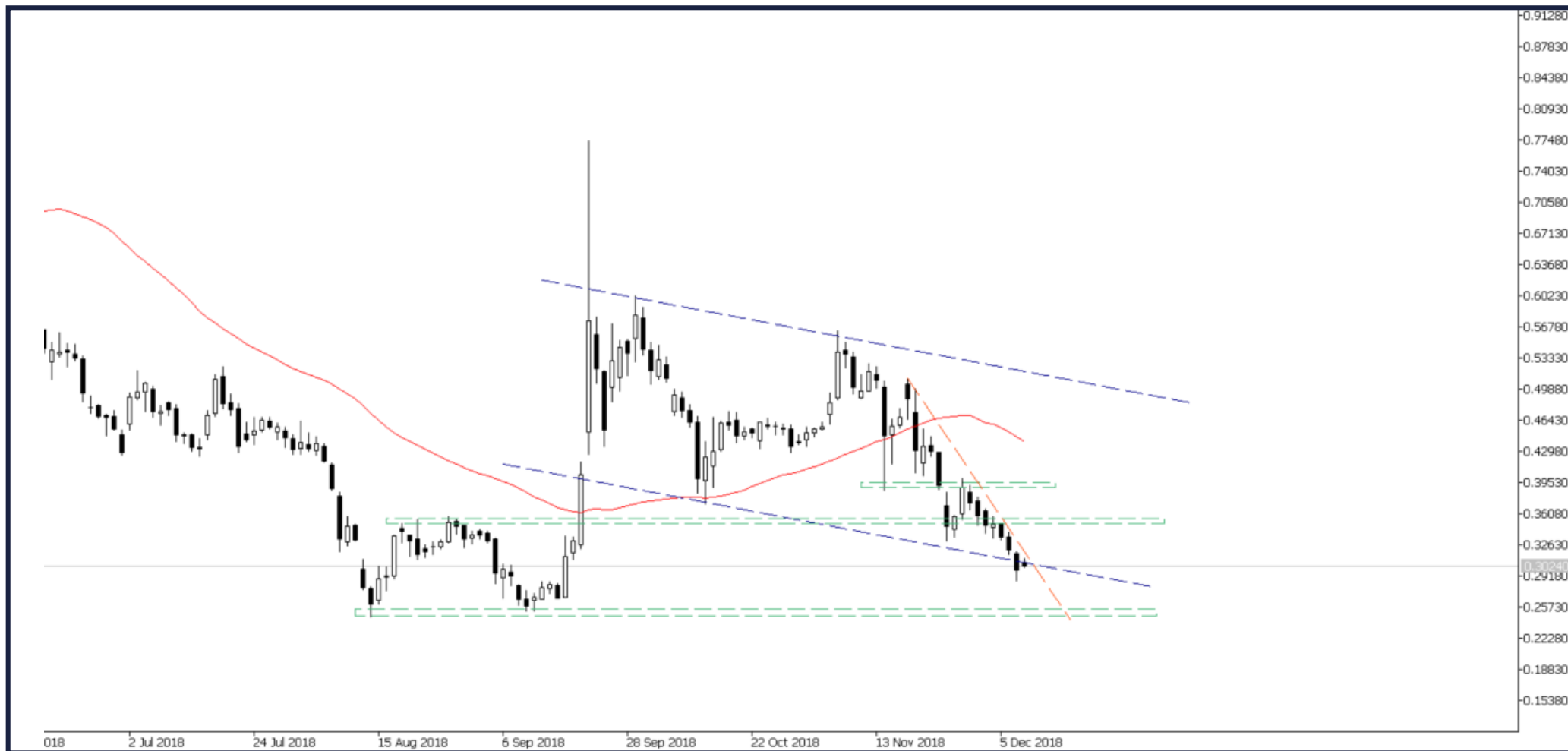
WYKRES 2: notowania kontraktu CFD na kryptowalutę Ripple, interwał dzienny, źródło: TMS Connect, MT5