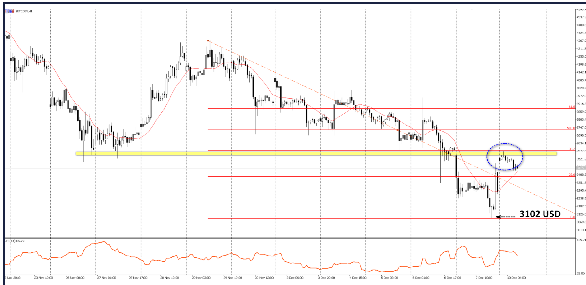
WYKRES 1 : notowania kontraktu CFD na kryptowalutę Bitcoin, interwał H1