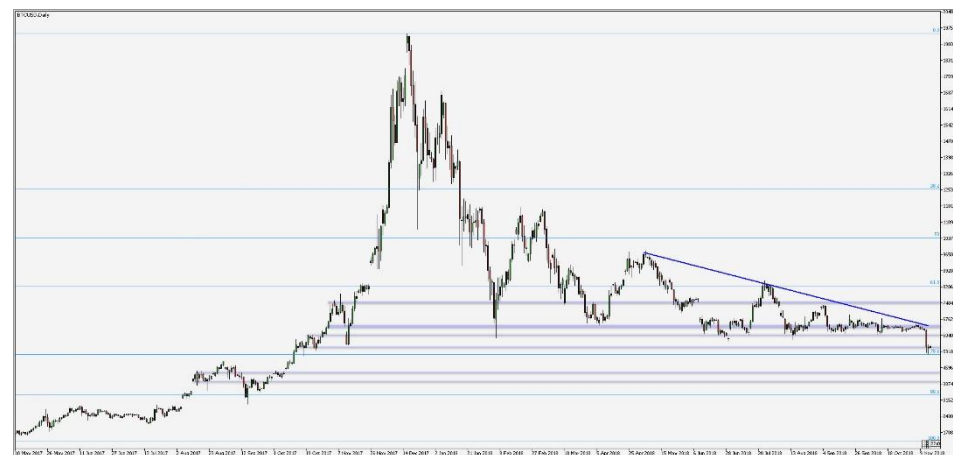
Wykres 4. CFD Bitcoin, interwał dzienny

Notowania Bitcoina znajdują się przy 5520 USD; gwałtowny spadek ceny w tym tygodniu sprawił, że przez moment kryptowaluta sprzedawana była po 5200 USD, najtaniej od X 2017. Przy wspomnianym minimum (5200) pojawiło się silne wsparcie (notowania błyskawicznie odbiły się od 5200 i wzrosły powyżej 5500, gdzie aktualnie się utrzymują), a dodatkowo poziom pokrywa się ze zniesieniem Fibonacciego 0,786 wzrostu od wybicia 1300 (V 2017) do historycznego maksimum powyżej 19500 (17 XII 2017). Można przypuszczać, że w najbliższym czasie spadki zostały powstrzymane, jednak potwierdzeniem tej tezy byłoby przełamanie linii trendu spadkowego trwającego od V 2018. Zanim to nastąpi wcześniej oczekiwać można oporu przy 6000 (lok. min. VI-X), dodatkowym utrudnieniem będzie strefa 6400-6500, gdzie notowania konsolidowały się w ostatnich miesiącach (IX-X). Po odwróceniu trendu kolejne opory stanowią 7500 i 8250 (zniesienie Fibonacciego 0,618). W przypadku nieoczekiwanej kontynuacji spadków wsparcie stanowić będą 4400 (lok. max. VIII-X 2017), 4000 (lok. min. VIII-IX 2017) i 3400 (zniesienie Fibonacciego 88,6).