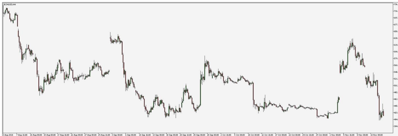
Wykres 3. CFD BCH (Bitcoin Cash), interwał 4 godzinowy (Notowania zostały wstrzymane w momencie rozdzielenia łańcucha)