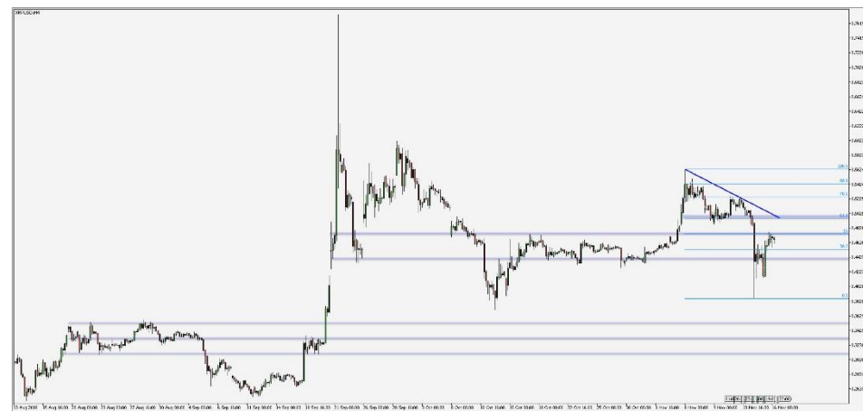
Wykres 5. CFD Ripple (XRP), interwał 4 godzinowy

Gwałtowna wyprzedaż nie ominęła Ripple (XRP), którego strata jest jednak niewielka w stosunku do pozostałych kryptowalut, w efekcie czego XRP awansuje na drugie miejsce wg kapitalizacji rynkowej, wyprzedzając Ethereum (ETH). Ponadto XRP neguje połowę spadku w momencie, gdy notowania pozostałych kryptowalut wciąż je kontynuują. Chwilowy opór napotyka przy 0,475, pokrywający się ze zniesieniem Fibonacciego 0,50. Dalsze wzrosty będą utrudnione przez strefę 0,495-0,50, przy której znajduje się nie tylko dotychczasowe wsparcie, ale również linia trendu spadkowego i zniesienie Fibonacciego 0,618. W przypadku wykazania siły i pokonania wspomnianej strefy późniejszych trudności można się spodziewać przy poziomach oporu pokrywających się z kolejnymi poziomami Fibonacciego: 0,525 (0,786; lokalne min. 6-7 XI), 0,543 (0,886; lokalne max. 6 XI) i 0,563 (max. XI). Ewentualne, dalsze problemy na rynku kryptowalut, skutkujące przełamaniem poziomów wsparcia przy 0,453 i 0,44 oraz kontynuowaniem spadku poniżej 0,385, mogą prowadzić do testowania kluczowych poziomów z VIII-IX (0,35; 0,33; 0,31).