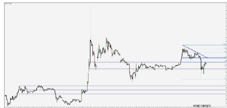
Wykres 2. CFD Ripple, interwał 4 godzinowy