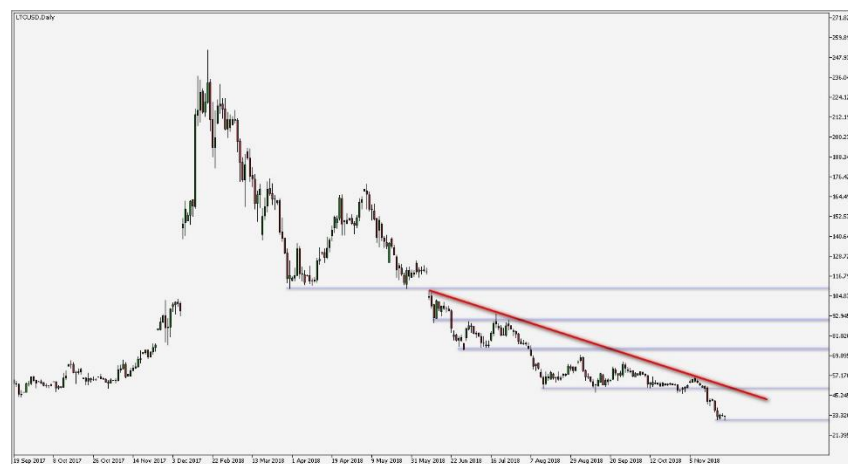
Wykres 5. CFD Litecoin (LTC), interwał dzienny