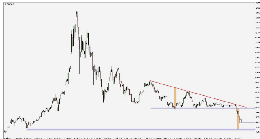
Wykres 4. CFD Bitcoin, interwał dzienny