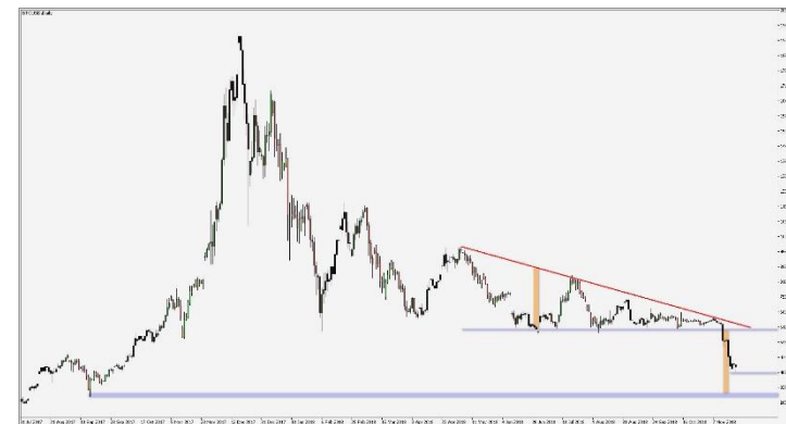
Wykres 1. CFD Bitcoin, interwał dzienny