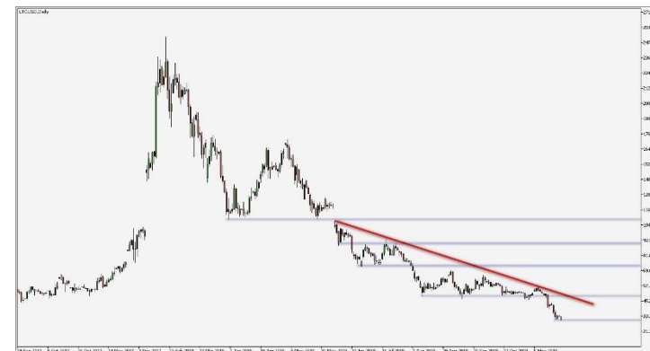
Wykres 2. CFD Litecoin, interwał dzienny