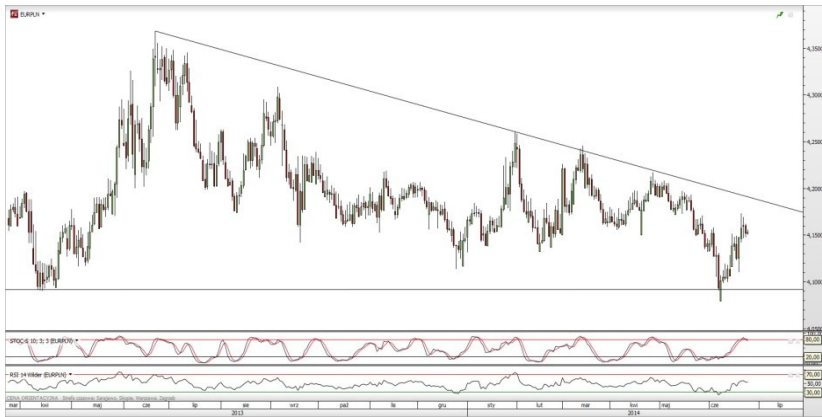
Rys. 2. Wykres dzienny EUR/PLN

Sytuacja ta jednak wpisuje się w nasz scenariusz krótkoterminowej korekty w notowaniach funta szterlinga, o którym pisaliśmy wczoraj (GBP/USD: test silnego oporu). W dłuższym terminie uważamy jednak, że funt ma szansę na dalszy wzrost wartości, zwłaszcza wobec euro. Rozbieżne drogi Banku Anglii i Europejskiego Banku Centralnego powinny bowiem przekładać się na zwiększenie korzystnej dla Wielkiej Brytanii różnicy w rynkowych stopach procentowych. Więcej na temat perspektyw polityki pieniężnej Banku Anglii prawdopodobnie dowiemy się już jutro. W trakcie swojego wystąpienia publicznego Mark Carney będzie miał szansę sprecyzować stanowisko władz monetarnych.