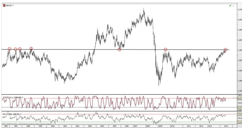
Rys. 3. Wykres tygodniowy kursu GBP/USD

Sytuacja ta jednak wpisuje się w nasz scenariusz krótkoterminowej korekty w notowaniach funta szterlinga, o którym pisaliśmy wczoraj (GBP/USD: test silnego oporu). W dłuższym terminie uważamy jednak, że funt ma szansę na dalszy wzrost wartości, zwłaszcza wobec euro. Rozbieżne drogi Banku Anglii i Europejskiego Banku Centralnego powinny bowiem przekładać się na zwiększenie korzystnej dla Wielkiej Brytanii różnicy w rynkowych stopach procentowych. Więcej na temat perspektyw polityki pieniężnej Banku Anglii prawdopodobnie dowiemy się już jutro. W trakcie swojego wystąpienia publicznego Mark Carney będzie miał szansę sprecyzować stanowisko władz monetarnych.