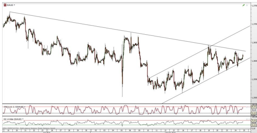
Rys. 1. Wykres godzinowy EUR/USD

Od początku tygodnia na rynku walutowym dominuje relatywnie niska zmienność. Kurs EUR/USD oscyluje wokół 1,36, EUR/PLN pozostaje między 4,15 a 4,16, natomiast USD/PLN między 3,06 a 3,06.