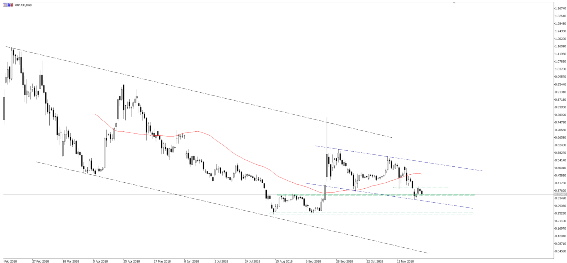
WYKRES 2: notowania kontrakt CFD na kryptowalutę Ripple, interwał dzienny