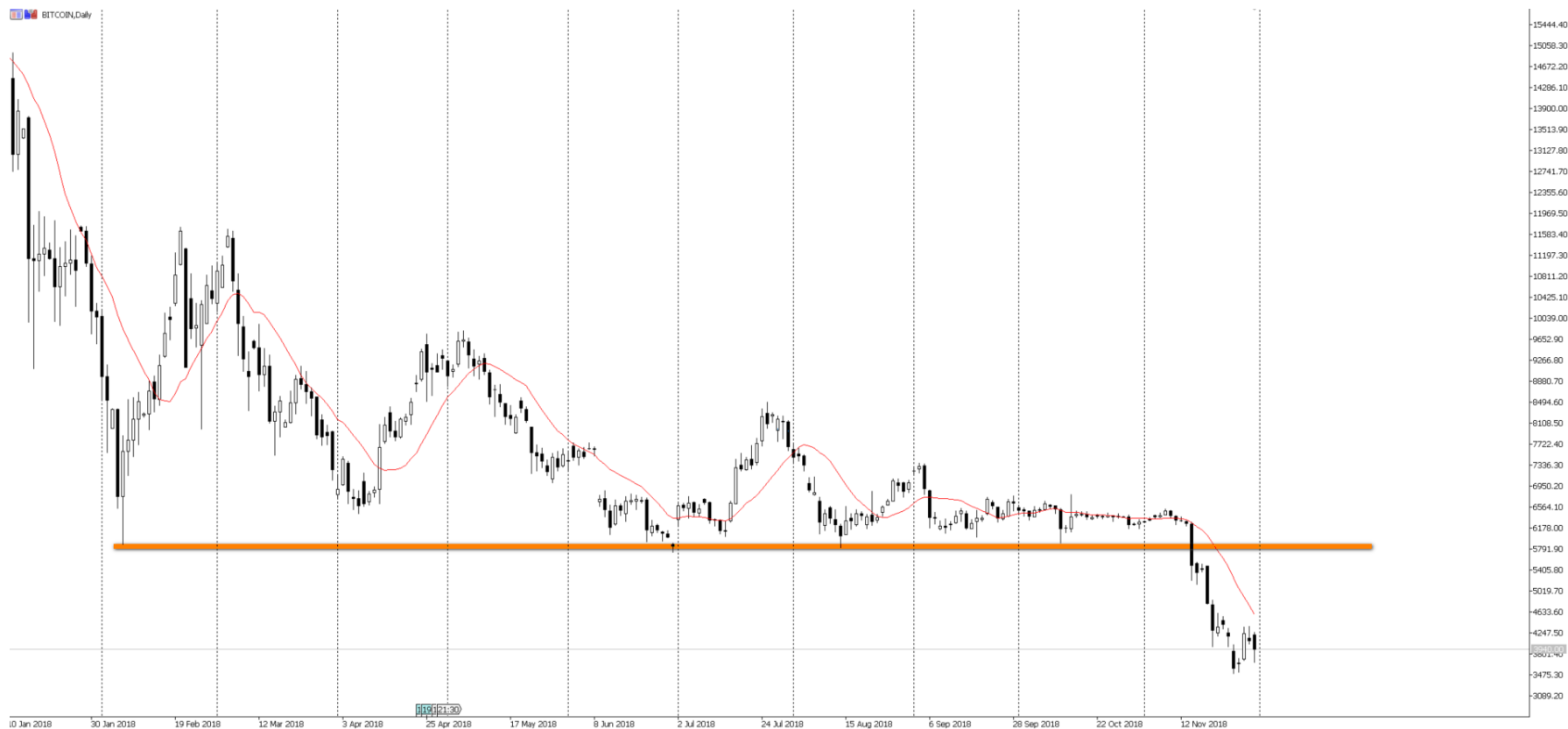
WYKRES 1 : notowania kontraktu CFD na kryptowalutę Bitcoin, interwał dzienny